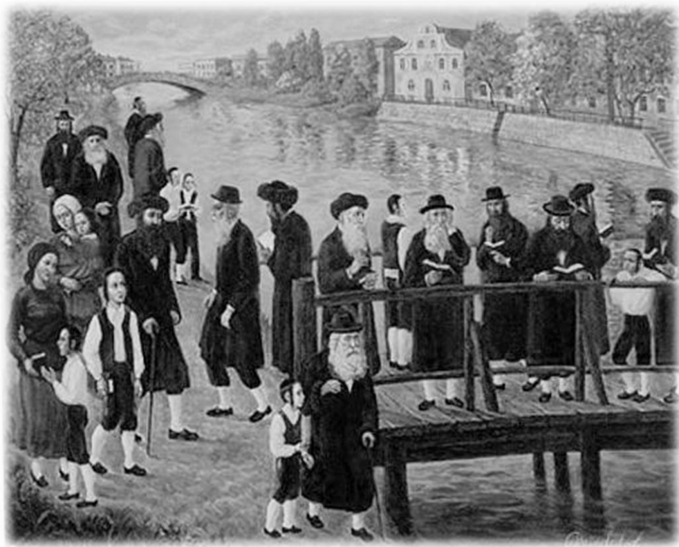
יהודים באמירת תשליך

ביום הראשון של ראש השנה אחרי תפילת מנחה לפני שקיעת השמש הולכים לים או לנהר או לבאר ואומרים תפילת "תשליך". התפילה נקראת כך משום שאנו משליכים את החטאים במקום שבו לא יישאר כל זכר. נוהגים לנער את שולי הבגדים לסימן שאנו משליכים את החטאים מעלינו.