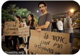
עתירה לבג"צ נגד 'חוק החרם' שאוסר קריאה לחרם על גורם רק מחמת זיקתו לישראל