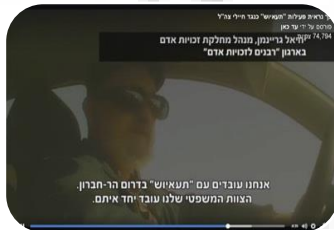
מימון ארגון 'תעאיוש' המייצר הפרות סדר נגד חיילי צה"ל