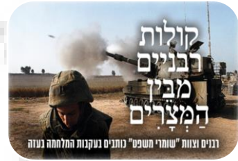
האשמת צה"ל בפשעי מלחמה במבצע עופרת יצוקה (2008)