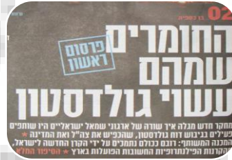
מסירת מידע לשם כתיבת דו"ח גולדסטון על עופרת יצוקה (2009)