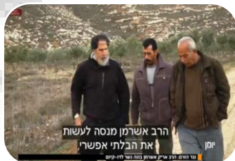
שותפות בכתיבת דו"ח נגד פעילות צה"ל ביו"ש (2015) עם ארגון 'כרם נבות'.