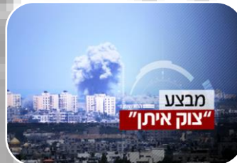
האשמת ישראל בהפרת החוק הבינלאומי במהלך מבצע צוק איתן במכתב ליועמ"ש (2014)