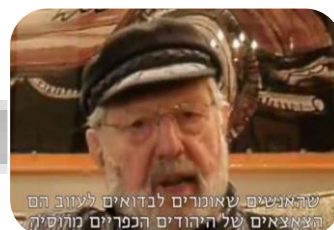
קמפיין נבזי להכפשת ישראל בנוגע לניסיונות הסדרת הבדואים בנגב (2013)