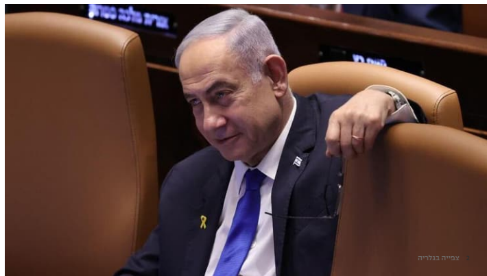
בנימין נתניהו

סרט דוקומנטרי חדש בשם The Bibi Files, מבית היוצר של המפיק האמריקאי זוכה פרס האוסקר אלכס גיבני, מבטיח להפיל פצצה פוליטית שעשויה לטלטל את מסדרונות בלפור. הסרט בן השעתיים, שיוקרן בשבוע הבא בהצגת בכורה בפסטיבל הסרטים הבינלאומי של טורנטו (TIFF), חושף קטעי חקירות משטרתיות שטרם נראו של ראש הממשלה בנימין נתניהו, אשר נאספו כחלק מהחקירות נגדו באשמות שוחד, מרמה והפרת אמונים. כידוע, לפי החוק בישראל - הקלטות של חקירות אסורות בפרסום ללא אישור בית המשפט. כיוון שהסרט יוצר ומוקרן מעבר לים - ספק אם החוק תקף, אולם בארץ תעלה שאלה חוקית אם מותר לשדרן.